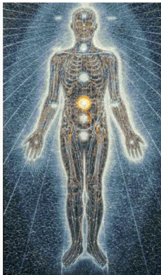
anatomía física y cuerpo energético o sutil.(3)

Si damos un paso más en esta dirección, podemos hablar de como en nuestros cuerpos sutiles, que tienen origen electromagnético, se grava información, que puede venir de nuestro sistema emocional, de nuestro sistema mental o del karma familiar.